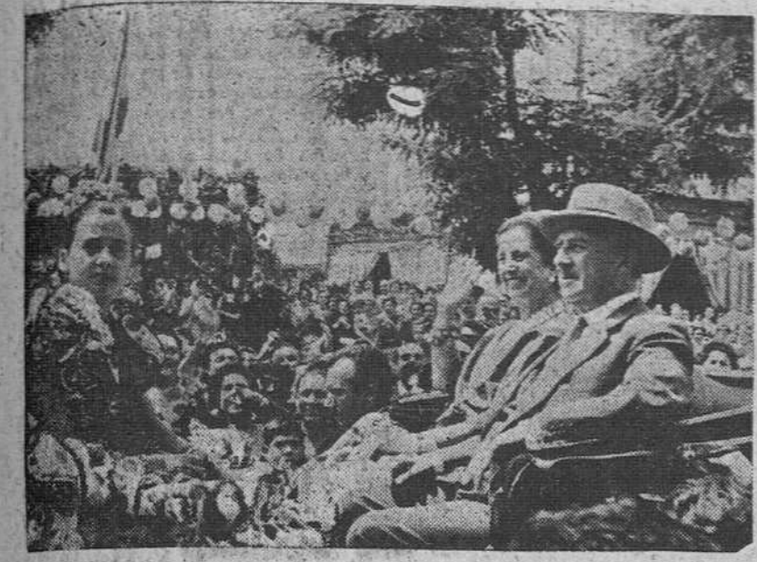
Sevilla. — S. E. el Jefe del Estado, acompañado de su esposa y nietas, recorriendo en coche de caballos el Real de la Feria. Una gran multitud les tributó cariñosas muestras de afecto y adhesión.

Inauguró el Seminario diocesano, un Colegio menor, la Casa Sindical y 496 viviendas protegidas