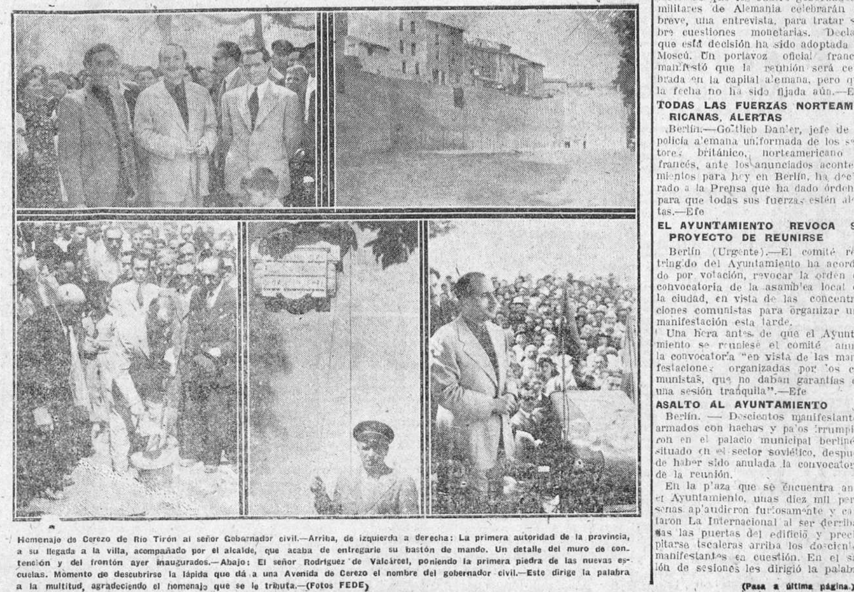
Homenaje de Cerezo de Río Tiron al señor Gobernador civil.—Arriba, de izquierda a derecha: La primera autoridad de la provincia, a su llegada a la villa, acompañado por el alcalde, que acaba de entregarle su bastón de mando. Un detalle del muro de contención y del frontón ayer inaugurados.—Abajo: El señor Rodríguez de Valcárcel, poniendo la primera piedra de las nuevas escuelas. Momento de descubrirse la lápida que da a una Avenida de Cerezo el nombre del gobernador civil.—Este dirige la palabra a la multitud, agradeciendo el homenaje que se le tributa.