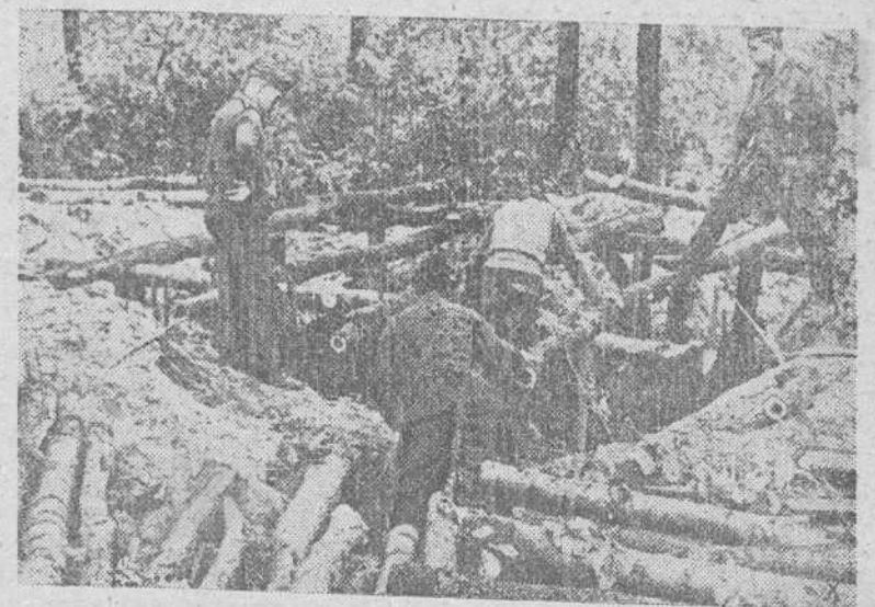
Zapadores alemanes construy en abrigos para la infantería.