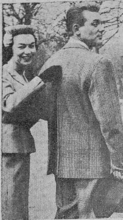
La chaqueta puede abrirse por detrás para permitir mayor libertad de movimiento. Así el traje se transforma en "sport" para la caza, el golf, etcétera.