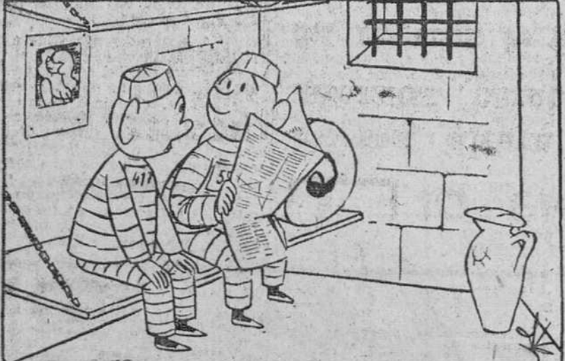
—El problema de la vivienda les resulta cada día más difícil.