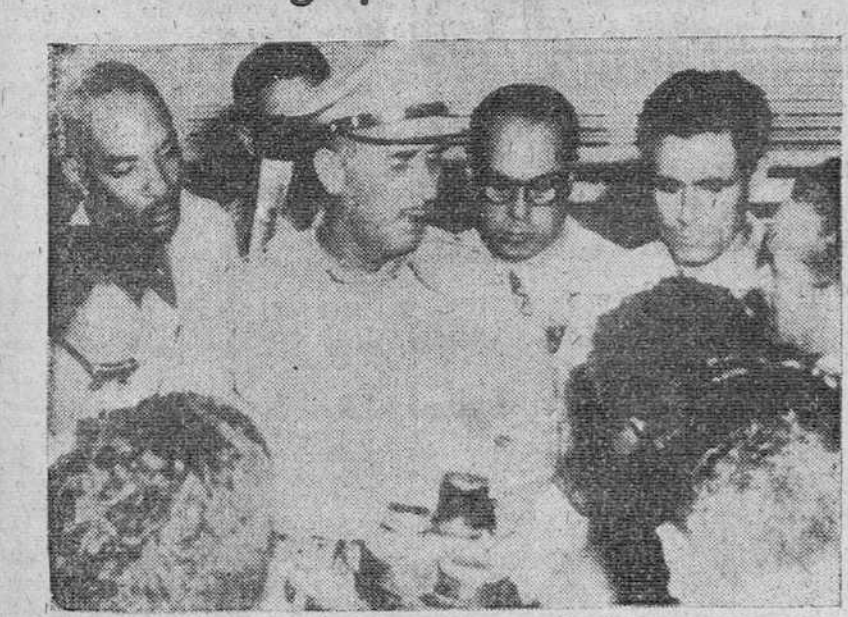
Santiago de Cuba. — El general Martín Díaz Tamayo, comandante militar de la provincia de Oriente, informa a los periodistas sobre los detalles de las operaciones llevadas a cabo para aplastar a los sediciosos, de los cuales once resultaron muertos y otros treinta heridos durante los combates de dos días de duración habidos en las calles de esta ciudad.