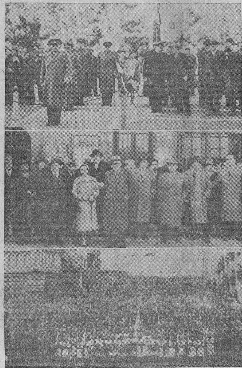
Con la acostumbrada solemnidad se celebró ayer en nuestra ciudad la fiesta de la Inmaculada Concepción. En el precedente grabado figuran placas obtenidas por "Fede" de los actos organizados por el Arma de Infantería, el Colegio de Abogados y la Juventud Obrera Católica.