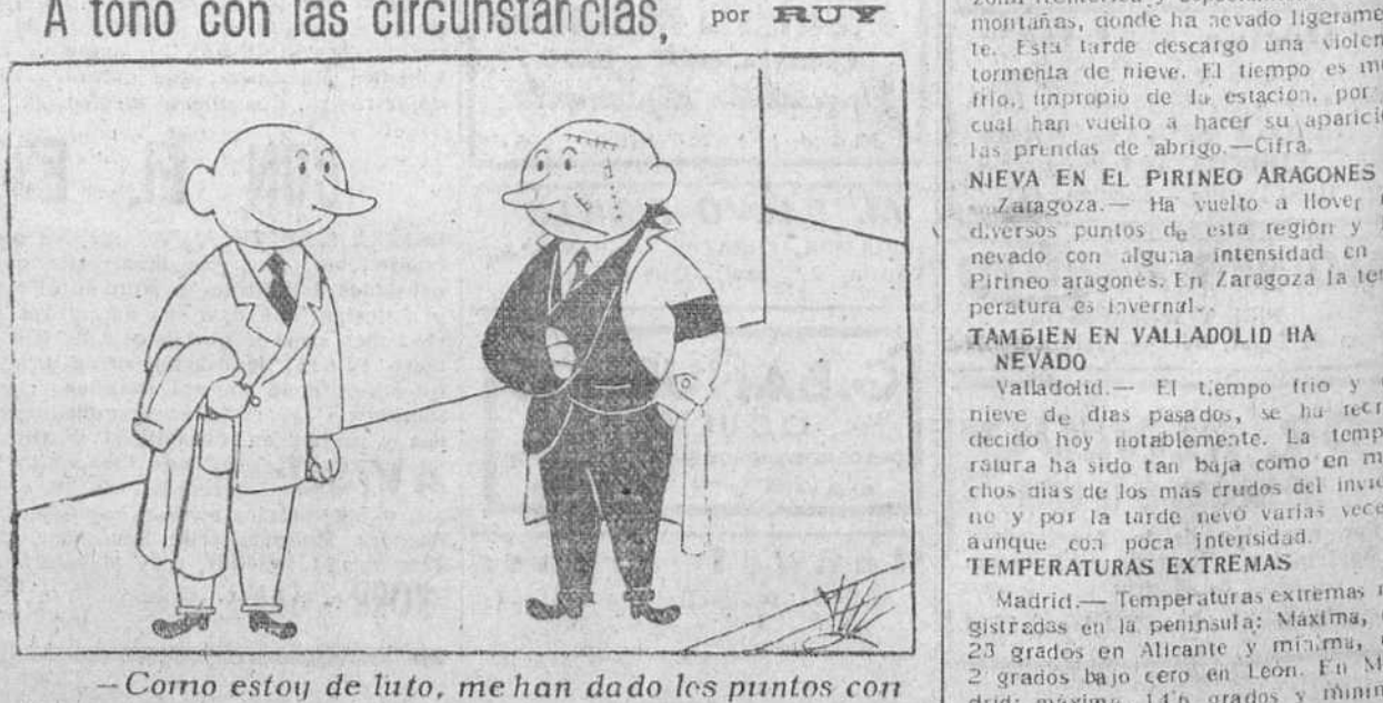
—Como estoy de luto, me han dado los puntos con hilo negro

Están en muchos hogares. Es una especie muy conocida pero que resiste todos los productos corrientes. Aunque mueran algunos, en pocos días salen tantos como antes. Nunca se acaba con ellas.