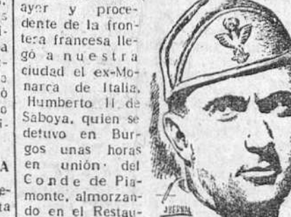
Rey Humberto II de Saboya

A primera hora de la tarde, los egregios huéspedes que realizan el viaje de incógnito, abandonaron la capital, dirigiéndose hacia Estoril (Portugal) donde, según noticias, el Rey Humberto es esperado por su esposa la Reina María José.