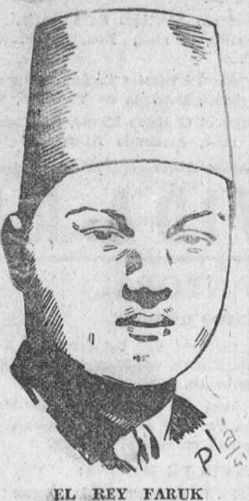
EL REY FARUK

BEVIN INICIARA CONSULTAS Londres.—El ministro de Asuntos Exteriores británico, Ernest Bevin consultará acerca del fracaso de las