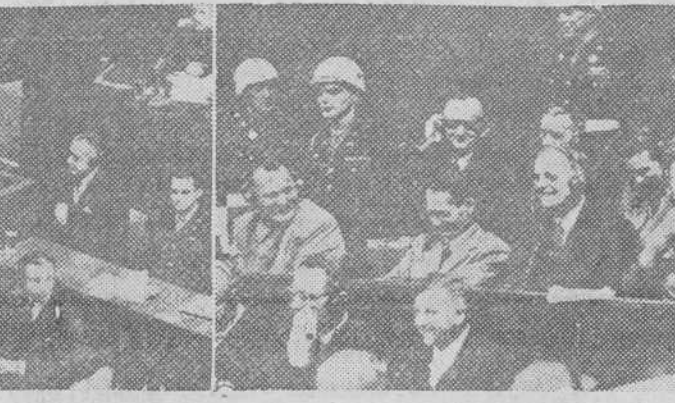
Ante el Tribunal de Nuremberg, utilizando un altavoz declara el general Krwin Lachusen, del Servicio Secreto Alemán. Las dos fotografías corresponden al momento de la declaración y es curioso el contraste entre una y otra que recogen la seriedad del testigo y la hilaridad que sus declaraciones producen entre los acusados