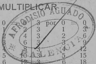
TABLA DE MULTIPLICAR