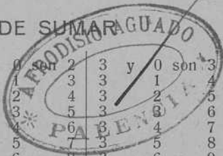
TABLA DE SUMARAGUADO