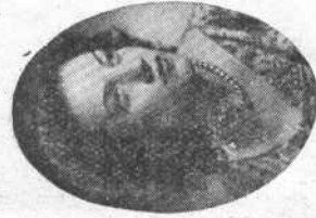
ASUNCION GIL Tiple Lírico-Dramática