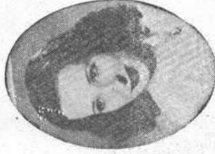
ENCARNITA MAÑÉ Tiple cómica