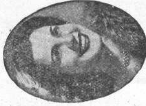
JOSEFINA CANALES Tiple Lírico- Ligera