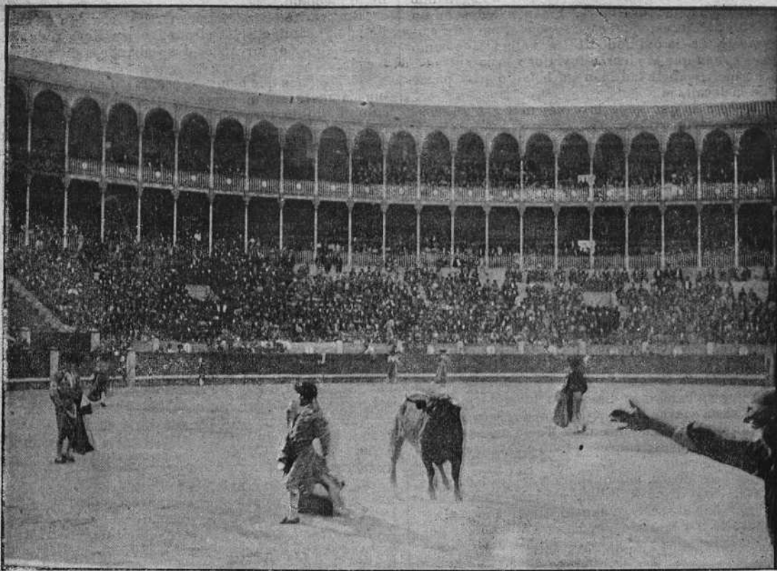
Una larga de Minuto.

En quites y toreando á igual altura que su compañero; en banderillas superior.