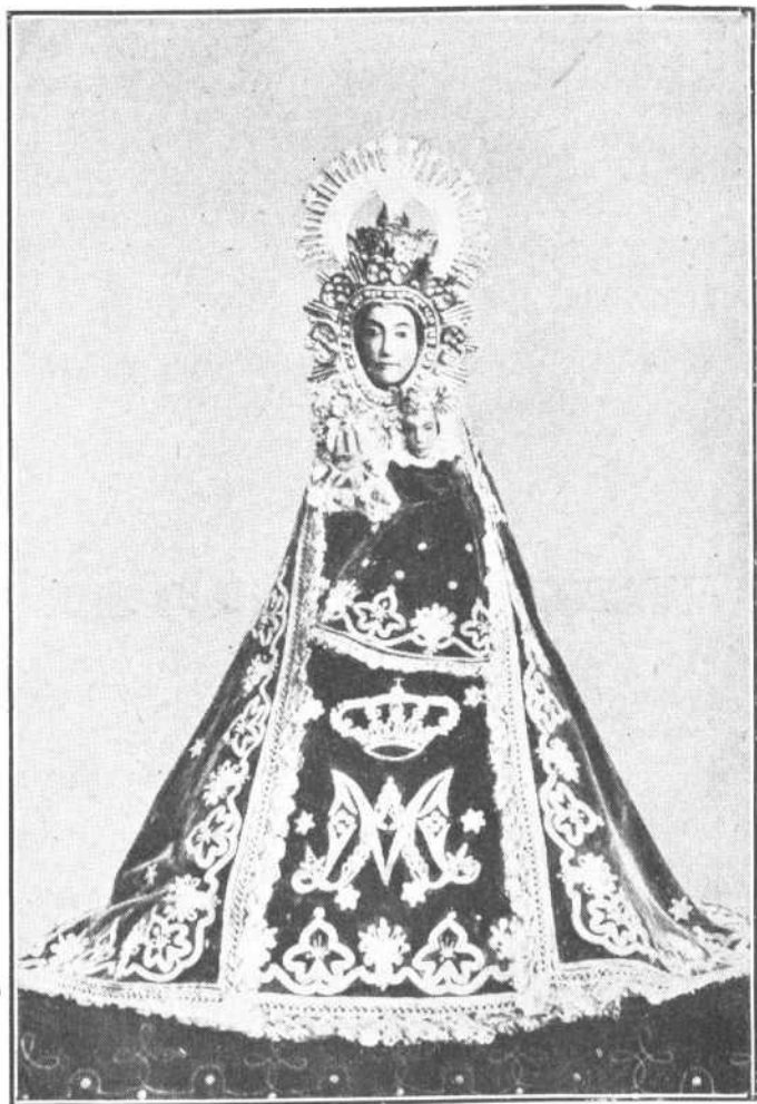
Nuestra Sra. de la Zarza, patrona de Villamañán