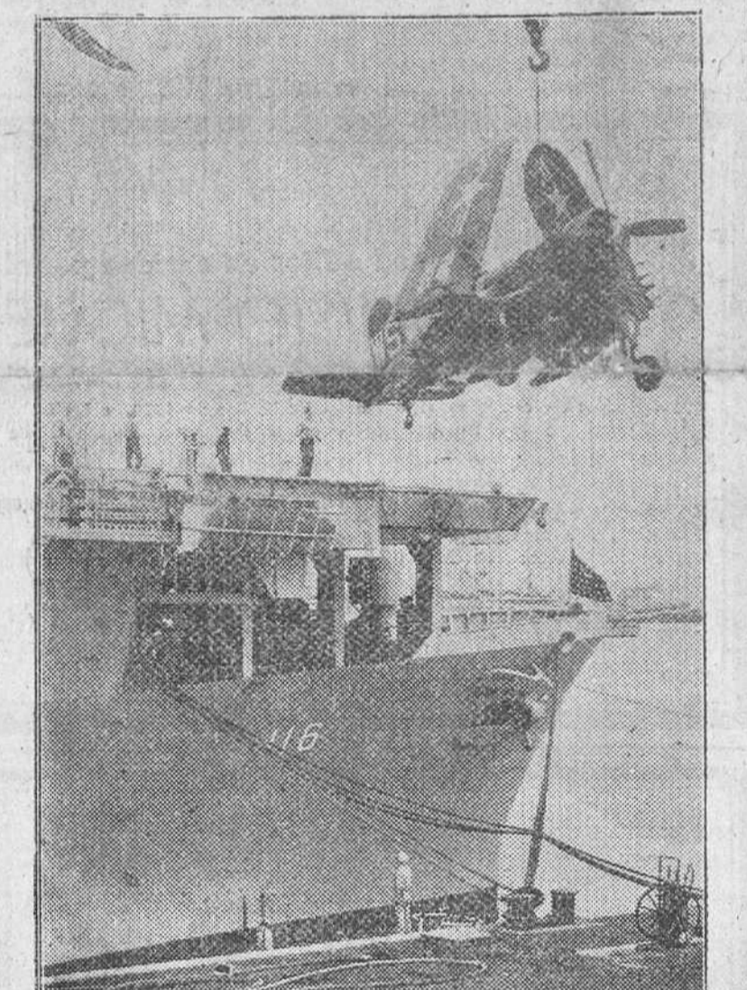
A BORDO DE UN PORTAAVIONES NORTEAMERICANO SON CARGADOS EN UNA BASE NAVAL DEL PACIFICO, AVIONES DE CAZA CON DESTINO A LA GUERRA DE COREA.