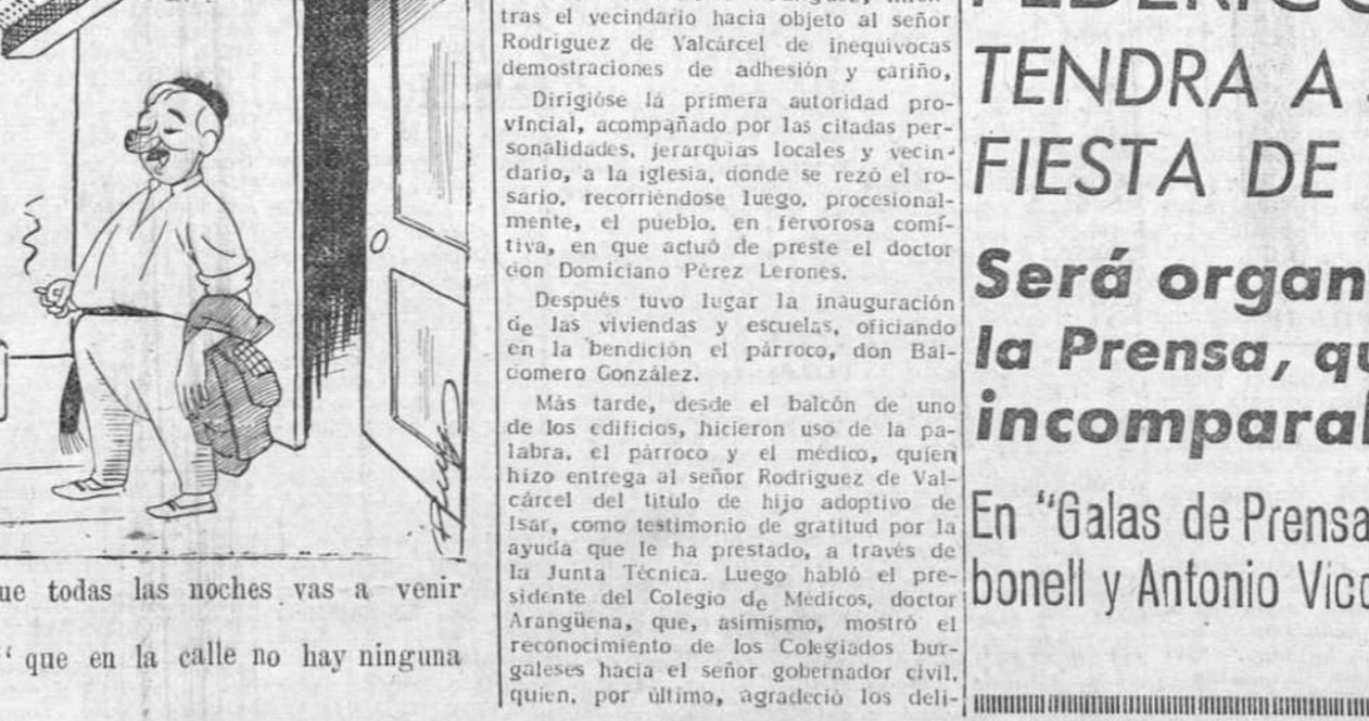
—Pero, bueno; ¿es que todas las noches vas a venir "alumbrar"? —Mujer..., "arreglara" que en la calle no hay ninguna bombilla.