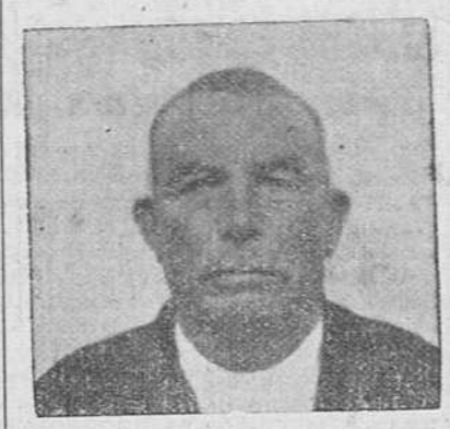
UNA PAGINA DE NUESTRA HISTORIA

Los hechos heroicos del soldado español forman esas maravillosas epopeyas que reciben el nombre de "glorias patrias"