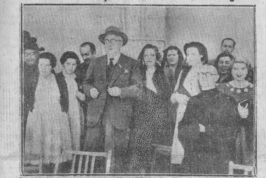
EL CAPITAN GENERAL DE LA REGION, TENIENTE GENERAL YAGUE, SU DISTINGUIDA ESPOSA E HIJOS, GOBERNADOR CIVIL DE LA PROVINCIA, VICARIO GENERAL DEL ARZOBISPADO Y UN GRUPO DE ASISTENTES, PRESIDENDO LA FIESTA CELEBRADA AYER EN LA "BARRIADA YAGUE", CON MOTIVO DE LA FESTIVIDAD DE SAN JUAN BAUTISTA.