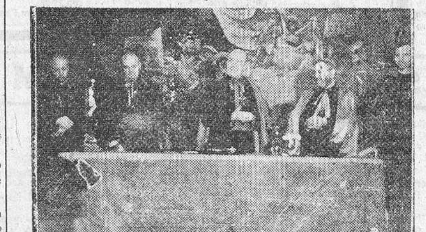
EL EXCMO. SR. ARZOBISPO, CON LOS PRELADOS QUE LE ACOMPAÑARON EN LA SOLEMNE SESION DE CLAUSURA DE LA SEMANA DE ORIENTACION MISIONAL.