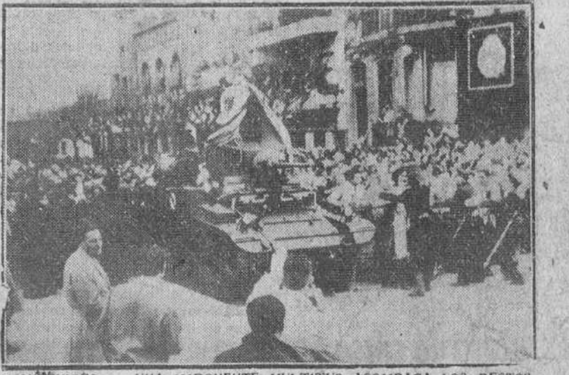
MONTEVIDEO. — UNA IMPONENTE MULTITUD ACOMPARA LOS RESTOS DEL GENERAL ARTIGAS, TRANSPORTADOS EN UN TANQUE HASTA EL PARQUE BATTLE Y ORDONEZ. A PESAR DE LA INCLEMENCIA DEL TIEMPO, MILLARES DE PERSONAS HICIERON ESCOLTA DE HONOR A LOS RESTOS DEL FUNDADOR DEL URUGUAY, DE ORIGEN ESPAÑOL.