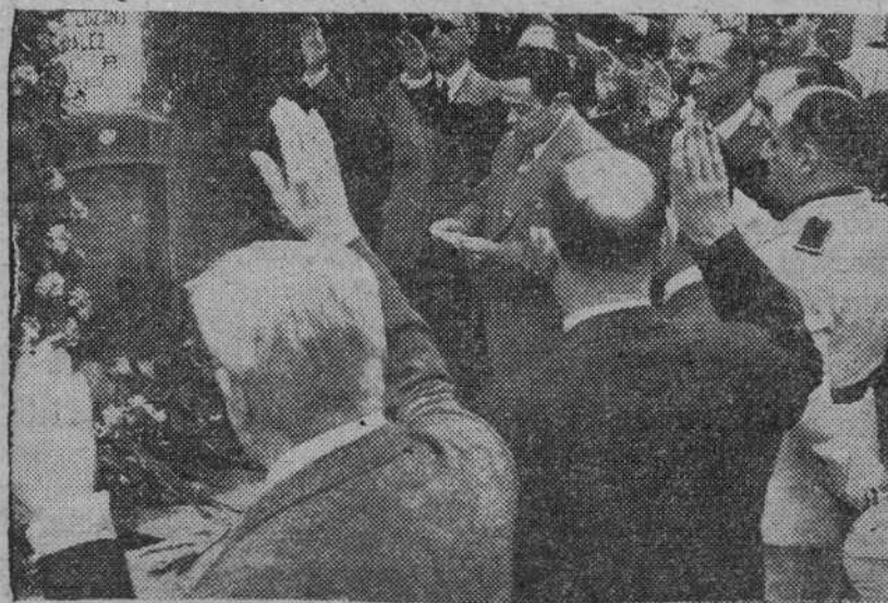
En Madrid se ha celebrado el día del periodista caído. He aquí la presidencia del acto