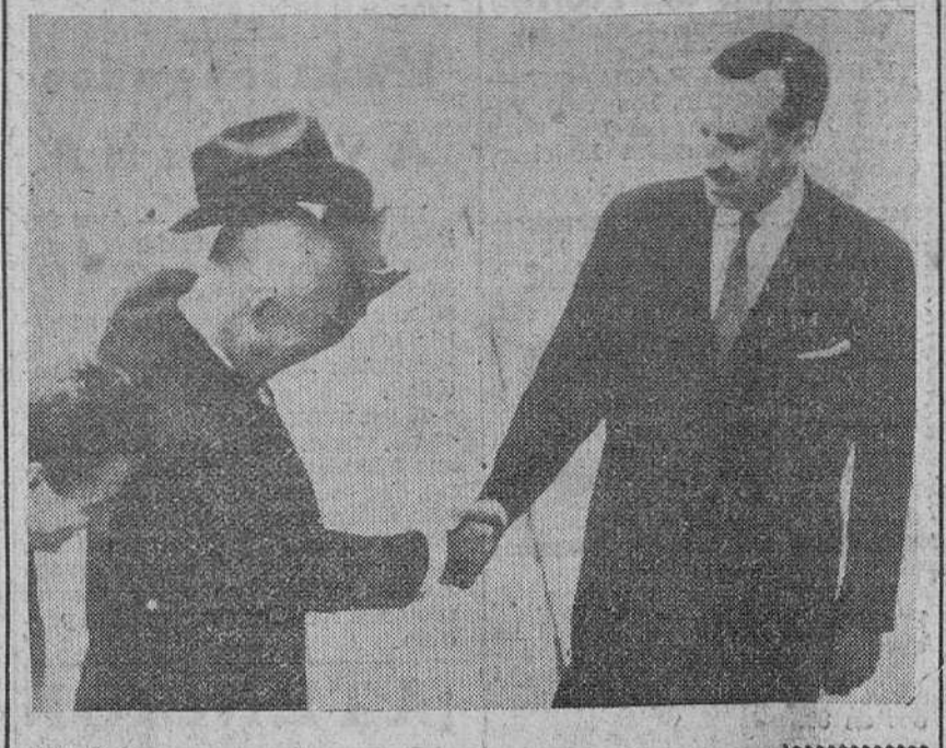
Paris. — El presidente Eisenhower a su llegada al Palacio del Eliseo para asistir a la conferencia "cumbre" Este-Oeste juntamente con el presidente De Gaulle y los primeros ministros de Inglaterra y Rusia, es saludado por el primer ministro de Francia, M. Debré. A la izquierda, René Broillet ayudante del presidente De Gaulle.

Los grandes occidentales manifiestan la inutilidad de todo esfuerzo por salvarla, a causa de la actitud soviética