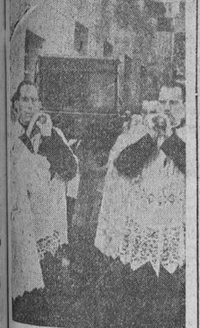
Entierro del obispo auxiliar de Toledo

El Cardenal Tardini se limitó a recordar que después de la muerte de Su Santidad Pío XII espero conseguir un cierto período de descanso. "En lugar de ello — declaró — recibí el nom-