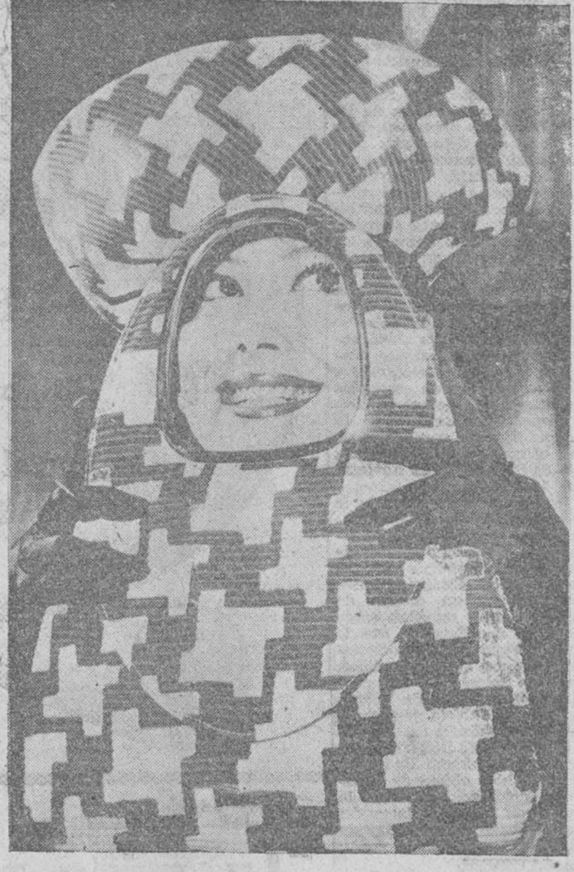
Estilo mejicano Londres. — Haciendo juego con el vestido, este sombrero estilo mejicano ha sido presentado en una colección ofrecida por el gremio de sombrereros británicos en el hotel Dorchester de esta capital. — (Foto San Antonio)