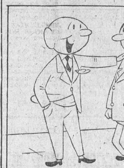
—¿Te acuerdas de cuántas veces nos «fumábamos» las clases para «dar palo» en las huertas?

CADA vez me interesan más las cosas, porque cada día me gusta más la vida. No todas las cosas, naturalmente. Hablo en general y me refiero a esa legítima curiosidad que debe existir en las personas normales —no dignas en los periodistas— como una constante renovación de las ganas de vivir. Ya se dijo que todo objeto se vuelve interesante, después de contemplarlo un rato. Hay que saber mirar, para descubrir en las cosas sus gotas de eternidad: su filosofía, su poesía, su amor.