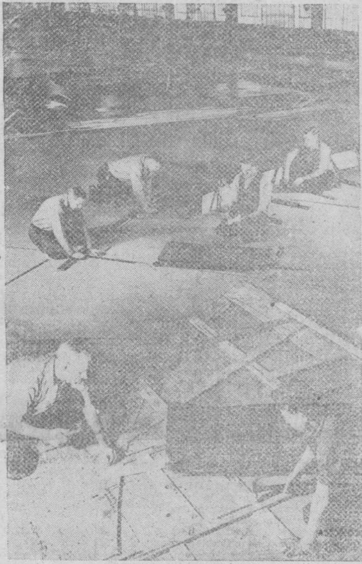
Con los planos al lado, los obreros de una importante factoría naval trazan las líneas por donde han de cortarse las planchas de acero que se instalarán en una nueva nave