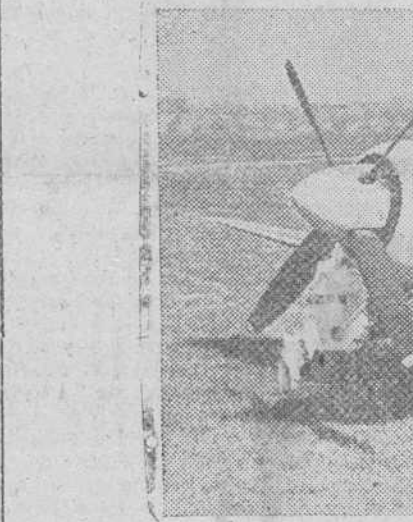
En un campo de aviación de Gran Bretaña, el nuevo caza "Tempest II", dotado entre otras particularidades de un armamento con cañones de 4x20 mm., se dispone a efectuar un vuelo de pruebas