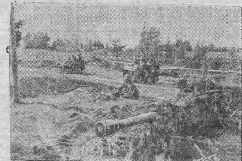
Nuevas unidades de carros de asalto marchan al punto culminante de la nueva ofensiva en el frente occidental