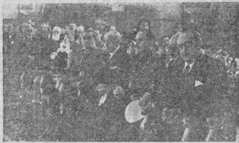
Madrid.—En San Francisco el Grande se celebraron los funerales por los españoles asesinados en Filipinas, víctimas de la barbarie japonesa. Al acto asistieron el ministro secretario general del Movimiento, presidente de las Cortes Españolas y el ministro de Marina, entre otras personalidades y jerarquías nacionales.