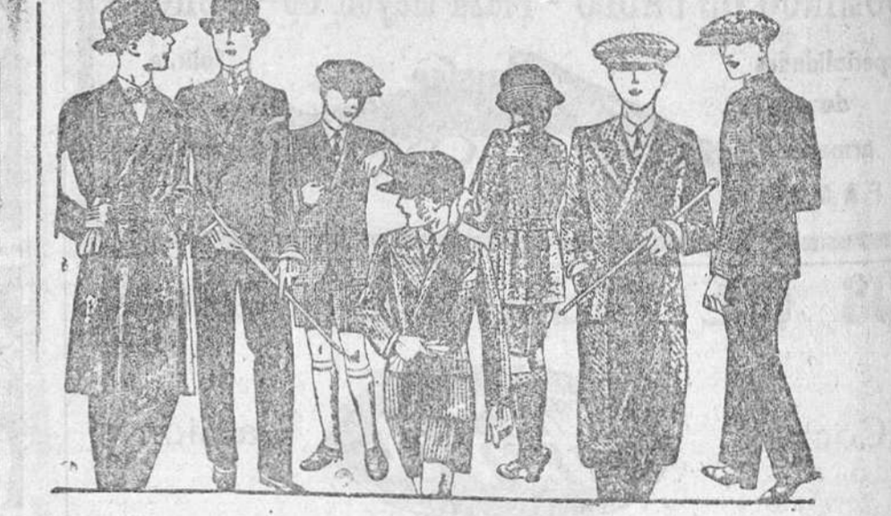
Trajes para jovencitos, edad de 12 a 20 años, a 40, 50, 60, 70 y 80 ptas.