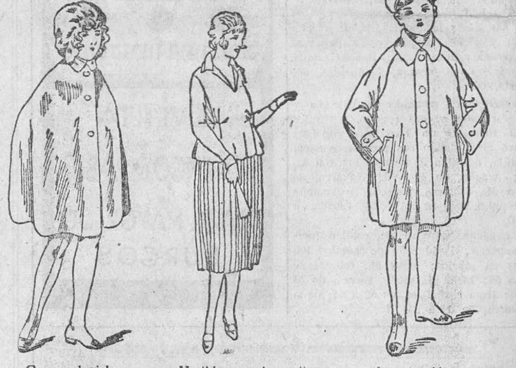
Capas colegiales, en distintos colores, a 8, 9, 10, 12 y 15 pesetas Vestidos para jovencitos en crepón o lana, a 15, 20 y 25 pesetas Impermeables, checos, a 18, 20, 22 y 30 pesetas

La casa que más surtido presenta y más barato vende, Siempre grandes existencias encontrarán en la Casa Munguía Plaza Mayor, 42, y Laín-Calvo, 9 y 11.-Burgos