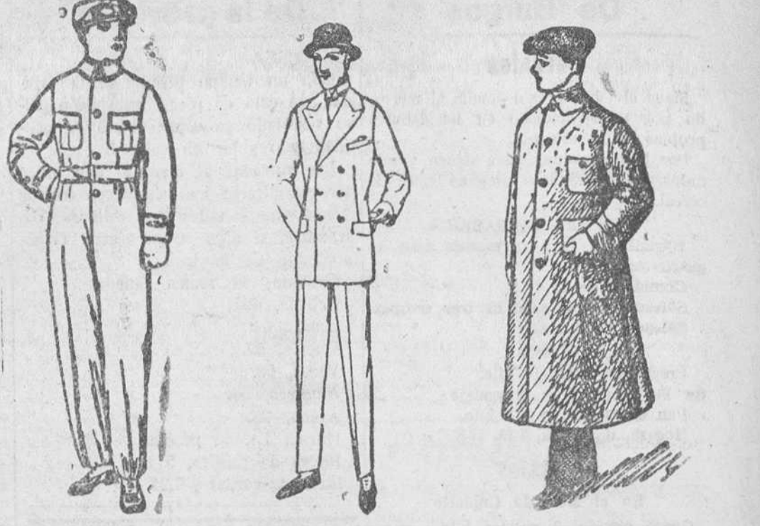
Buzca azul, color kaki y blancos, a 8, 10 y 15 ps. Trajes de confección fina, a 50, 60, 70 y 90 ps. Guardavillos en color gris y kaki, de 7 a 20 ps