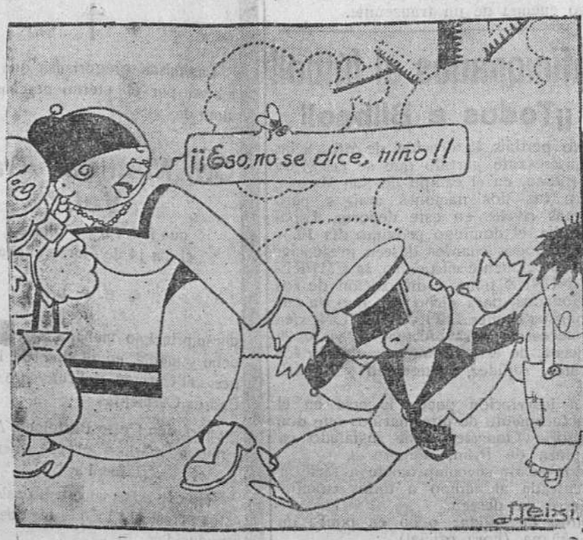
INEDUCACION —¡Anda, que mi padre ha salido concejal y el tuyo no.