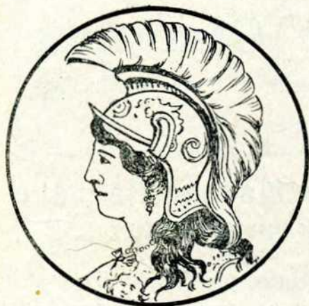
Fig. Fos de la Biblioteca... CULTURA