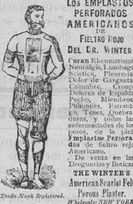
Trade Mark Registered. Wholesale NEW YORK