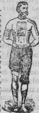
Trade Mark Registered.