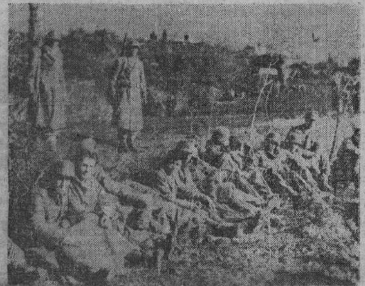
Los soldados franceses dan guardia a los prisioneros alemanes capturados en las luchas de Italia