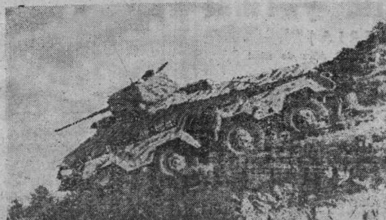
Este carro armado alemán, de los que se usan en gran número en las batallas sobre suelo italiano, se dirige hacia las líneas aliadas