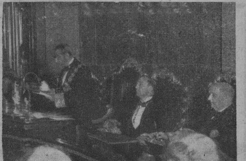
Momento en que el Presidente del Tribunal Supremo, don Felipe Clemente de Diego, pronuncia su discurso de apertura de los Tribunales (S. O. F.)