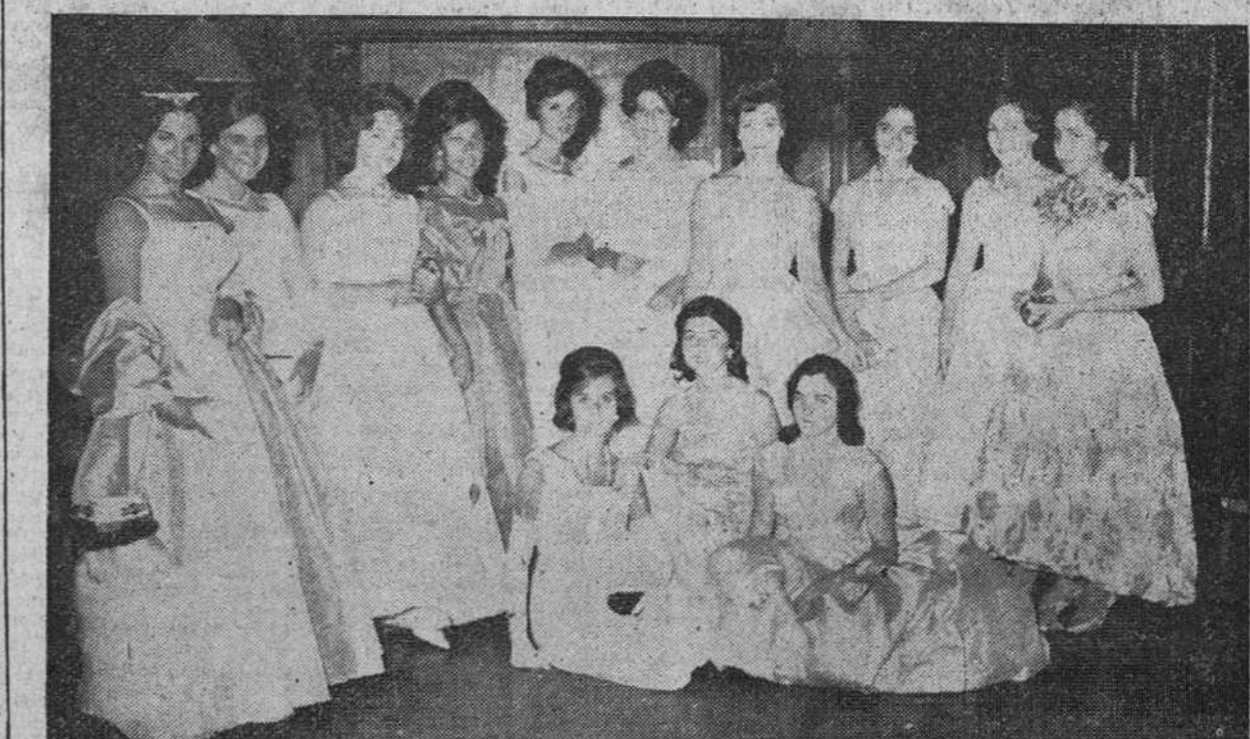
Fiesta de sociedad en el Salón de Recreo su presentación en sociedad en el baile celebrado en la noche del viernes, en el Salón de Recreo.

Viena. — Kruschef ha sorprendido esta tarde a los dirigentes austriacos al entregarse a un violento ataque contra el canciller Adenauer. El gobierno moscovita que se dirige a una reunión de la Asociación Austro-Soviética, celebrada en el Hofburg, el antiguo palacio imperial de la capital, volvió a hablar, en términos muy duros, de la política norteamericana de espionajes y del fracasado viaje del presidente Eisenhower al Japón.