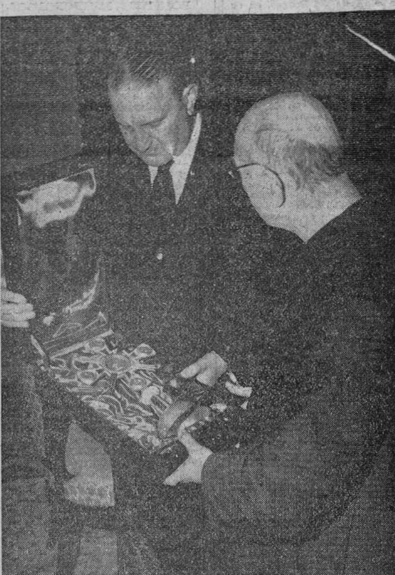
En el Ministerio de Asuntos Exteriores Madrid. — El ministro de Asuntos Exteriores, don Fernando Maria Castiella, hace entrega al Reverendo Padre Abad de Santa Cruz del Valle de los Caídos de un «Lignum Crucis» y setenta y siete reliquias de Santos españoles procedentes del Tesoro Sacro del Vaticano.

RECORD DE VUELO SIN ESCALA Singapur. — El avión «Valiant» de bombardeo ha aterrizado esta mañana en esta ciudad después de batir un record de 8.100 millas sin escala desde la base de Marham, en Inglaterra. El aparato fue repostado en ocasiones durante el viaje en pleno vuelo mediante aviones que despegaron de Akrotiri, Chipre, Mauritipur y Pakistán. El vuelo duró 15 horas y 25 minutos con una velocidad media de 523 millas a la hora.