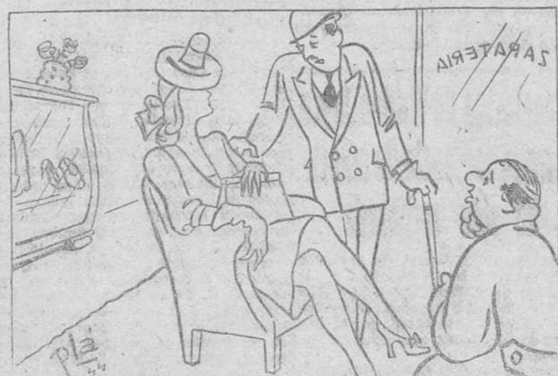
—Este Luis XV me está un poco pequeño. —Pues, nada... que te saquen un Luis XVI.