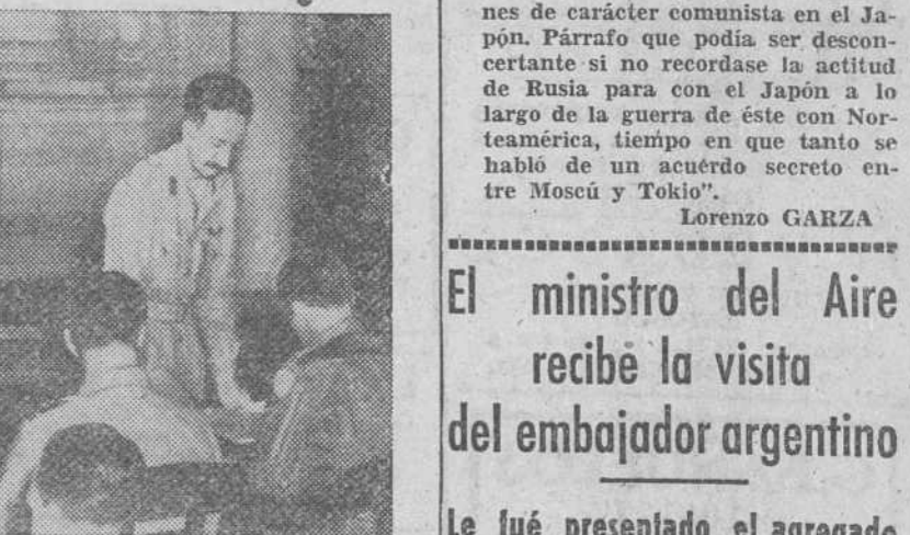
La firma de las condiciones preliminares de la rendición de Rangún. Firmaron por parte japonesa el general Takaso Numata y el almirante Kalgje Chudo