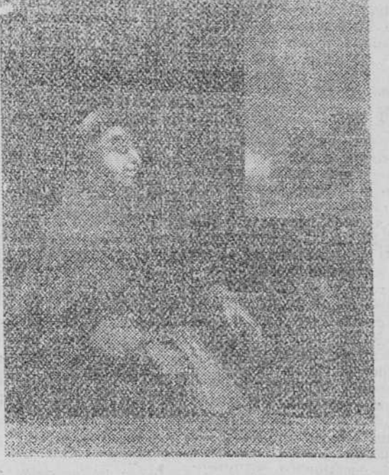
El pie de la reproducción de este cuadro nos da en breves líneas la fuerte personalidad del gran Cardenal Cisneros: "El V.º Siervo de Dios D. Fr. Francisco Jiménez de Cisneros Emisericatissimo Carden. Arpo de Toledo, repetidas veces Gobernador de España, Inquisidor General, Conquistador y defensor de Orán, Eretor de treinta Conventos y Comunidades, en especial del Colegio mayor de Sn. Ysidoro de Universidad de Alcalá"

El 8 de Noviembre de 1517—hace exactamente cuatrocientos veintiocho años—y después de pronunciar palabras de San Agustín: "Iste Dominus, speravi", moría el gran Cardenal y gobernante español, Francisco Jiménez de Cisneros. Nacido en el segundo tercio del siglo XV en la villa de Torre Laguna, hubo de empezar sus estudios en Alcalá de Henares, para después completarlos en Salamanca, donde se graduó de bachiller en Derecho civil y canónico. Veámosle después en Roma, ciudad en la que permaneció varios años. Más adelante, y de vuelta a su Patria, volvemos a encontrarle ocupando el arciprestazgo de Uceda, y luego la capellanía mayor de la Catedral de Sigüenza, en donde se halló bajo la autoridad del gran Cardenal Mendoza.