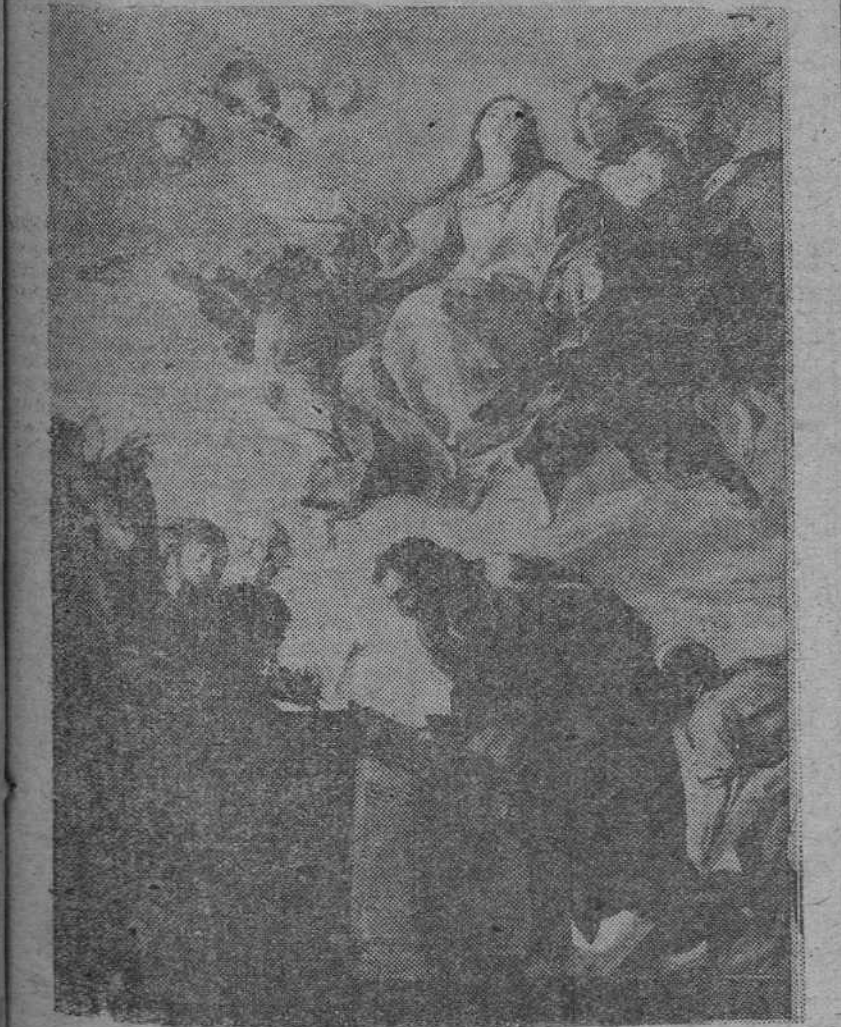
Quince de Agosto. Día de la Asunción de la Virgen. Cuadro de Cerezo que figura en el Museo del Prado

En esta época del año cristiano la de los cielos claros, diafanos, que parecen de diluido oriente de penta, hay unos días en que todos los pueblos de España, en sus ciudades, en sus aldeas, en sus villas, por humildes que sean, a orilla del mar, o en la montaña, siguen fervorosamente el vuelo de