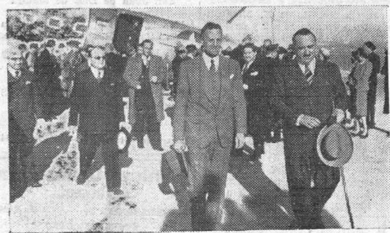
El nuevo embajador de los Estados Unidos en España, Mr. Wouman Armour, es recibido en el aeropuerto a su llegada a Madrid por el barón de las Torres, introductor de embajadores, en representación del ministro de Asuntos Exteriores.