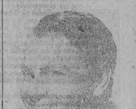
Joel McCrea, uno de los mejores actores americanos que tiene a su cargo el principal papel masculino en UNION PACIFICO, la película que hoy se estrena en CINE CALATRAVAS