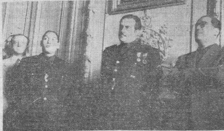
Arriba: El ministro secretario general del Movimiento y los de Educación Nacional y Marina, inauguran en los locales de la Escuela de Ingenieros la Exposición nacional de industria eléctrica, organizada por el Sindicato Nacional del Metal