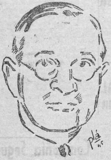
Mr. HARRY S. TRUMAN

Washington.—En su alocución radiada dirigida a las fuerzas armadas norteamericanas en todas las partes del mundo, el presidente Truman, dijo: