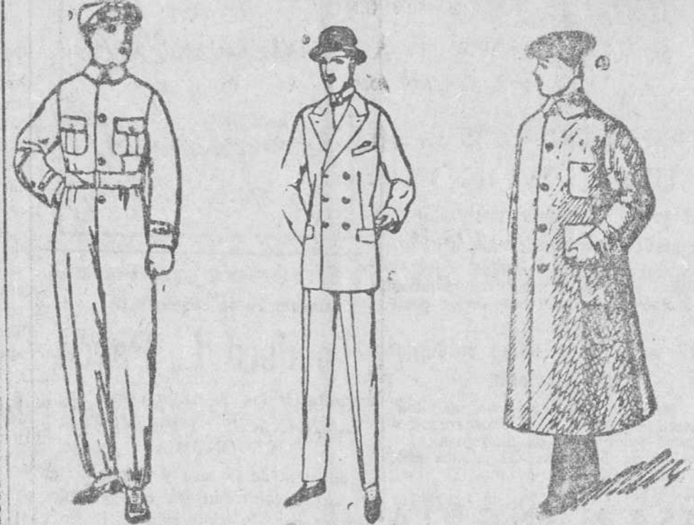
Buzos azul color kaki y blancos, a 8, 10 y 15 ps. Trajes de colección fina, a 50, 60, 70 y 80 ps. Guardapolvos en color gris y kaki, de 7 a 20 ps

para caballero, señora, jóvenes y niños SASTRERIA Y PANERIA TELEFONO 603 R Establecimiento oficial del Turing Club Español