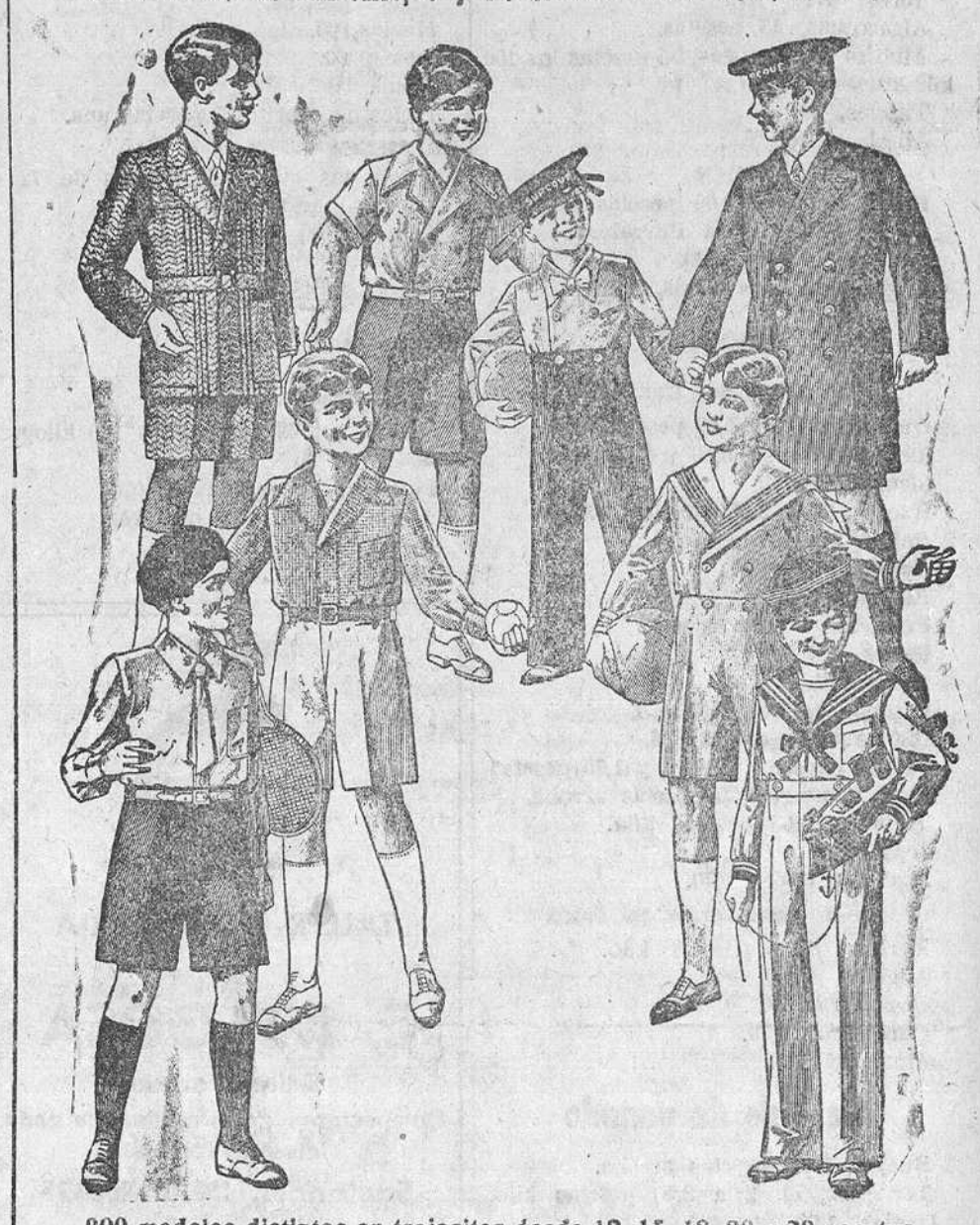
200 modelos distintos en trajecitos desde 12, 15, 18, 20 y 30 pesetas.

Plaza Mayor, 42. Lain-Calvo, 9 y 11.—Sucursal: Plaza Mayor, 8, Burgos