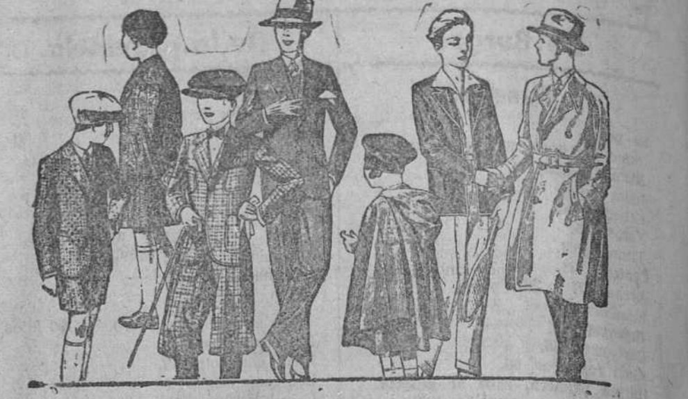
Abrigos y trajes de paño, modelos nuevos de 20, 25, 30, 35, 40 y 50 pesetas

Primera casa en confecciones para caballero, señora y niños. Plaza Mayor, 61, Lain-Calvo, 9 y 11.—Sacsural: Plaza Mayor, 6, Burgos. Teléfono, 603-R. Teléfono, 284