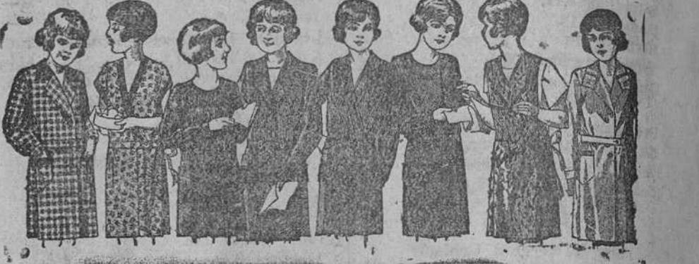
Vestiditos para niñas de 8 a 14 años, en crepón, seda o lana, de 12, 15, 18, 20 y 25 pesetas.