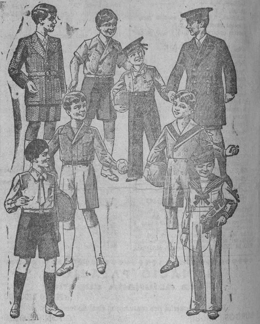
Trajecitos, modelos novedad, de 15, 18, 20, 25 y 30 pesetas. La Casa que más surtido presenta y más barato vende