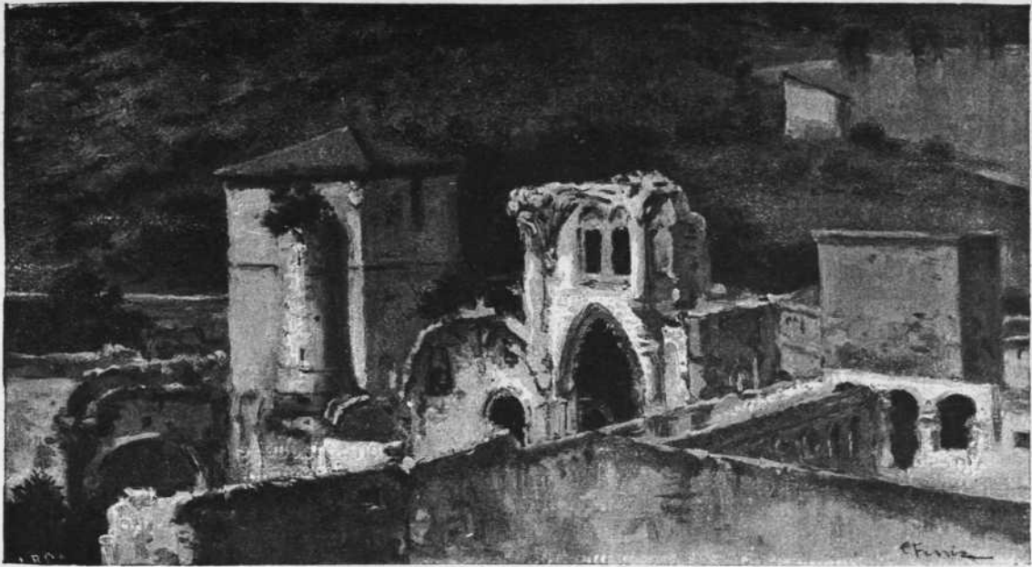
ASPECTO GENERAL DE LAS RUINAS