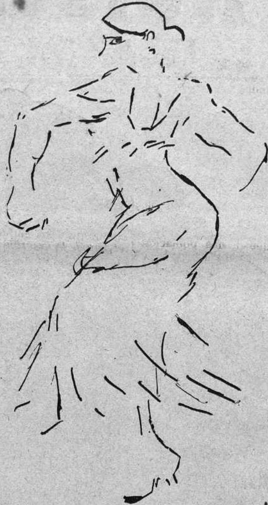
Es tan genial esta artista — que tras de pensarlo en serio nos hacemos pastoristas... — ¡Pero de Pastora Imperio! (¡Tontería de dibujo de Ricardo Marín!)