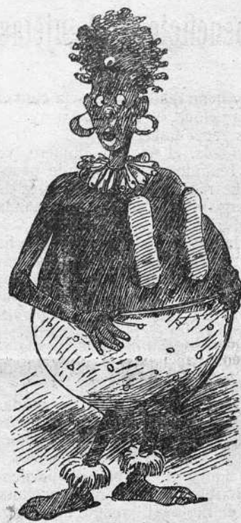
La reina de los juegos florales de Chi-guá-guá, celebrados en honor del hasta el pasado domingo, célebre forero Gaona.