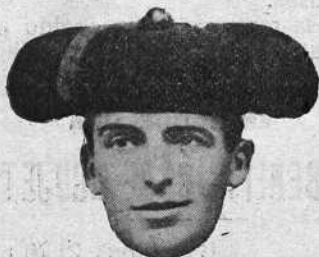
CHIQUITO DE BEGOÑA

Mató un primer toro superiormente; pero luego, compadre, qué manera de irse a los barrios bajos.