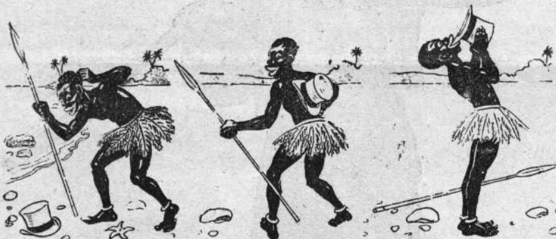
Instantánea del baile de etiqueta dado por los paisanos del Sr. Rodolfo.

Chi-guá-guá nos remite la adjunta curiosa información gráfica, que representa á varios admiradores del indio en plena orgia y á la bella reina de los florales elegida por votación popular.