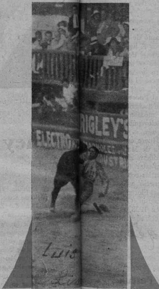
Resumen de la temporada de toros de 1932-1933