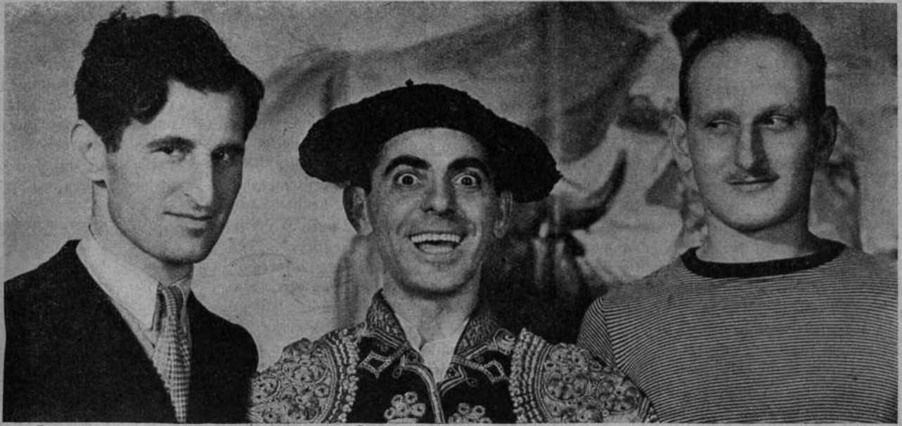
El director MC CAREY, EDDIE CANTOR y SIDNEY FRANKLIN durante un descanso de "Torero a la fuerza"