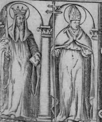
S. Casamiro Rey de Polonia ~ S. Adalberto de Bohemia.