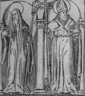
S. Columbario de Irlanda ~ S. Bonifacio de Inglaterra.

La paga de quatro mil ducados de principal , y docientos ducados de renta vitalicia.