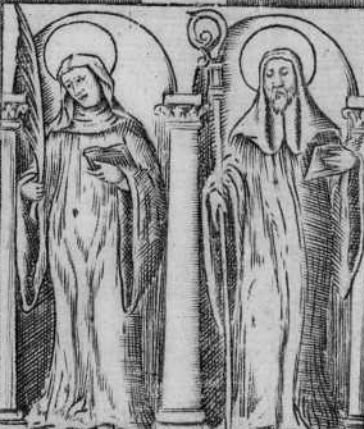
S. Yrene de Portugal. S. Millan de la Cogolla de Rioja.