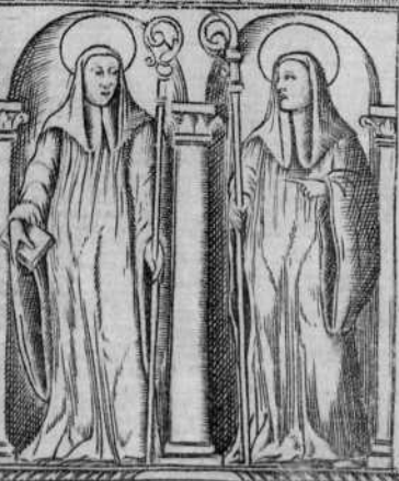
S. Ynigo de Aragon ~ S. Rosendo de Galicia.