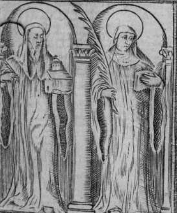
S. Ruperto de Alemania ~ S. Gertruda de Flandes.