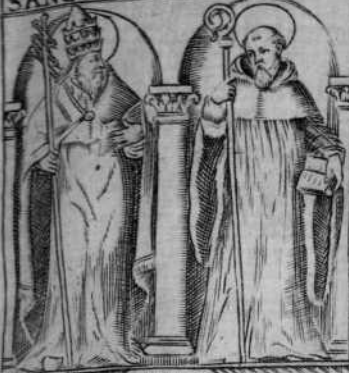
S. Gregorio Magno de Italia ~ S. Bernardo de Francia.