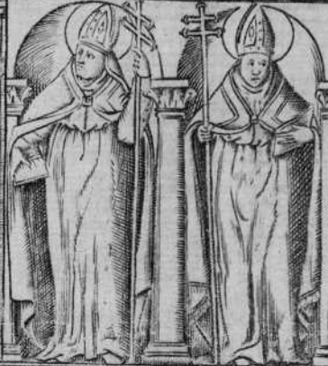
S. Leandro de Andalucia ~ S. Yliphonso de Castilla Nueva.