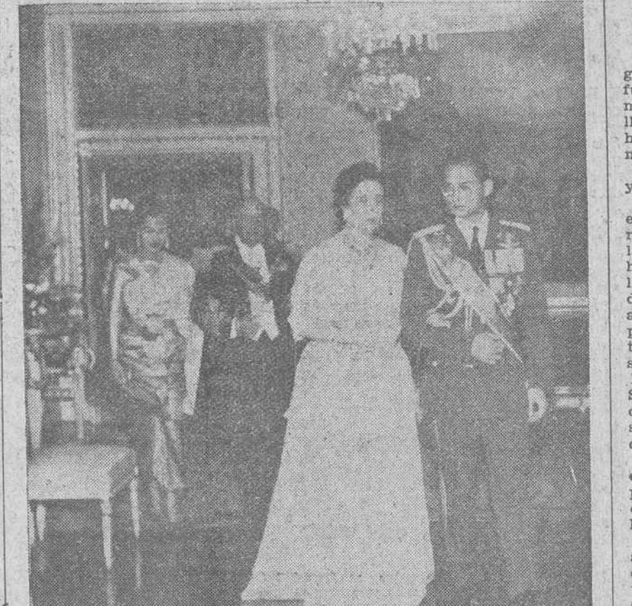
Madrid. — El Rey de Tailandia dando el brazo a Doña Carmen Polo de Franco seguidos de S. E. el Jefe del Estado y la Reina Sirkitt, haciendo su entrada en el comedor del Palacete de la Moncloa, donde los Soberanos tailandeses ofrecieron una cena al Generalísimo Franco y señora.