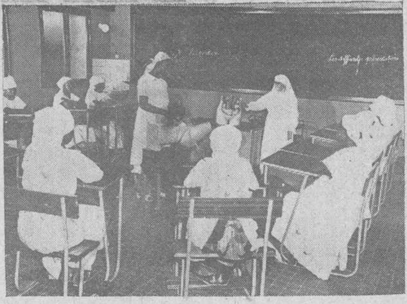
"Las monjas españolas se portaron en el Congo como pocas". Una religiosa durante una clase de puericultura y ginecología a unas indígenas.